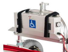
Υπερυψωμένη βάση μπαταρίας