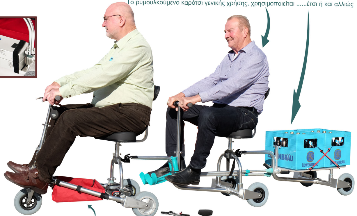
Για ελαφριά χειραποσκευή