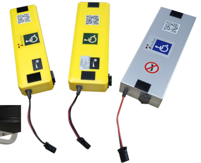
Τρεις διαφορετικές μπαταρίες ιόντων λιθίου προς επιλογή