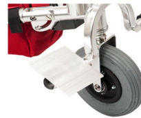
Πλάκα στήριξης ποδιών