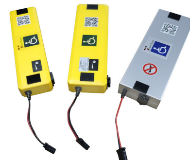
Drei verschiedene Lithium-Ionen-Batterien zur Auswahl