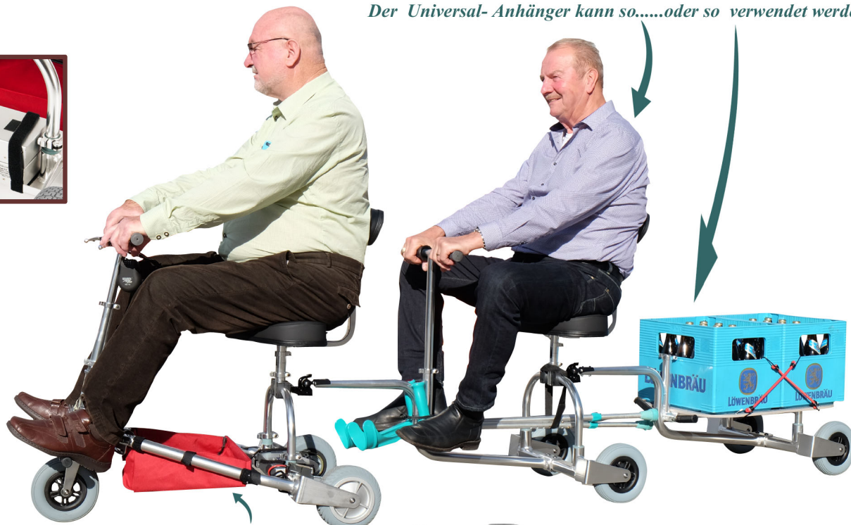
Für leichtes Handgepäck